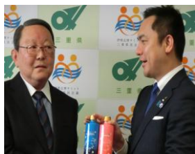
ボトルを受取り一言