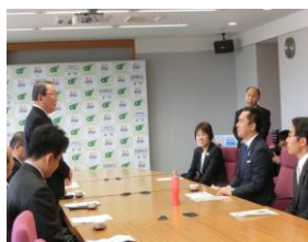
企画の報告をする重藤会長