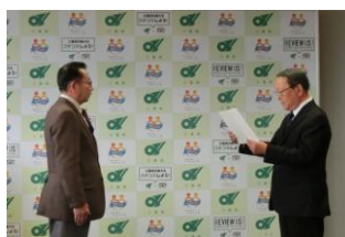
キャッチコピー表彰式