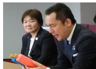
ボトルを手取る鈴木知事