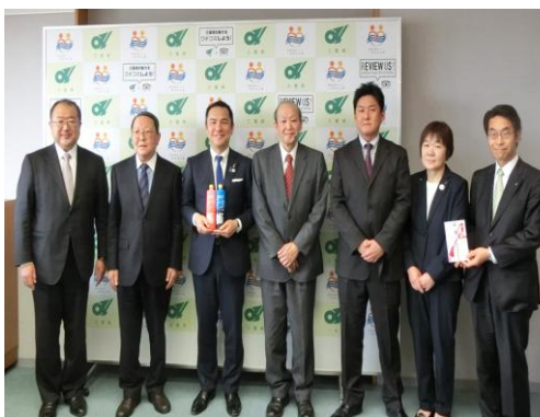
知事とともに参加者で記念撮影