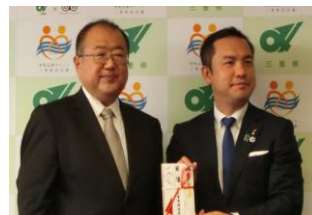
寄付金目録を寄贈