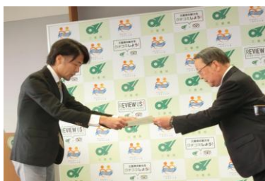
キャッチコピー表彰式