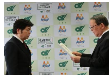
キャッチコピー表彰式