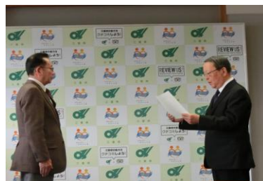
キャッチコピー表彰式